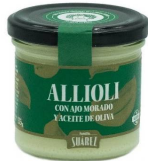
8162 - ALLIOLI 135 G ACEITE DE OLIVA 2,63 €/UD. - 6 UDS.