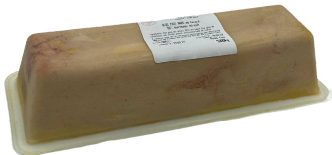
1024 - TARRINA DE BLOC FOIE 50 % TROZO 50,00 €/KG