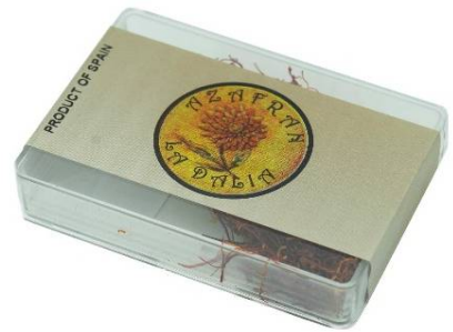
8104 - AZAFRAN 2 G LA DALIA 6,02 €/UD.