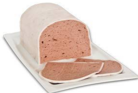
6921 - PATE DE CERDO 8,69 €/KG