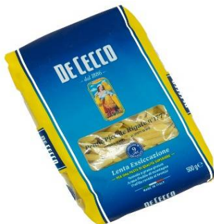
OSXE041 - PENNE RIGATE N°41 DE CECCO 500 G 1,82 €/UD.