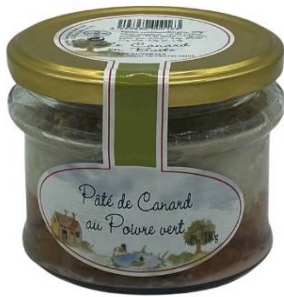
0435 - PATE DE CANARD CON PIMIENTA VERDE 180 G 3,33 €/UD.