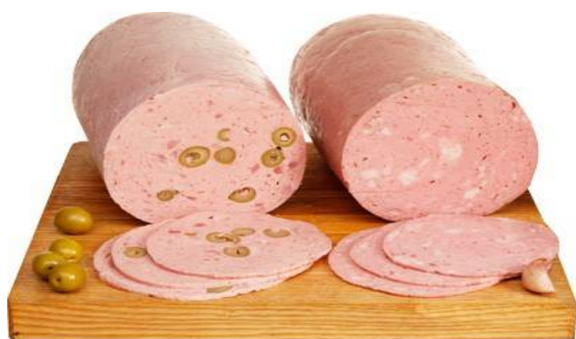
6919 - ESPALDA CON ACEITUNAS 9,98 €/KG