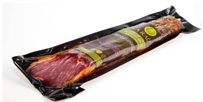
7029 - CAÑA DE LOMO IBERICO 50% LA RAIZ 32,12 €/KG