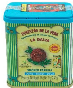
PIMIENTON DE LA VERA 8102 - DULCE 70 G 1,61 €/UD. 8103 - PICANTE 70 G 1,65 €/UD.