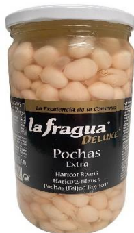
5312 - POCHAS BLANCAS V-720 x 12 UDS. 1,45 €/UD.