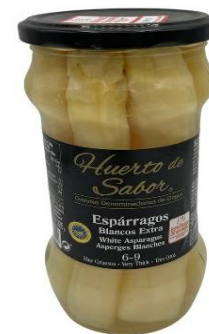
5266 - ESPARRAGO EXTRA 6/9 NAVARRA D.O. M-580 X 12 UDS. 5,86 €/UD.